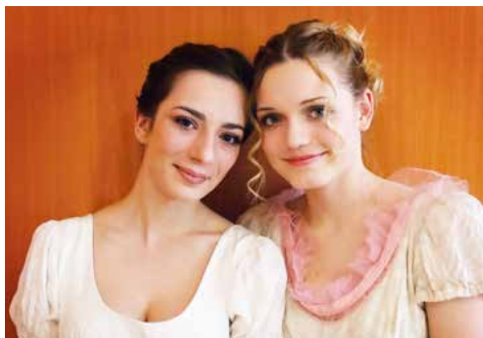
Jane Austenová v podání žákyň Střední zdravotnické školy v Praze 4