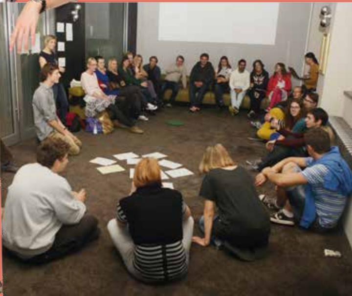
Seminář pro bývalé dobrovolníky EDS 2014

Evropská dobrovolná služba (EDS) umožňuje mladým lidem zapojit se individuálně nebo ve skupinách do dobrovolnických projektů konaných v zemích EU a v partnerských zemích. Dobrovolník má prostřednictvím EDS příležitost vycestovat do zahraničí, seznámit se s novou kulturou a rozvinout své jazykové kompetence. Dobrovolná služba prostřednictvím práce v hostitelské organizaci také umožňuje získat nová přátelství a příležitost k individuálnímu růstu prostřednictvím neformálního a informálního učení. Každý účastník projektu má zároveň právo obdržet Youthpass, certifikát, který potvrzuje účast v projektu a může tak pomoci při uplatnění této zkušenosti na trhu práce.