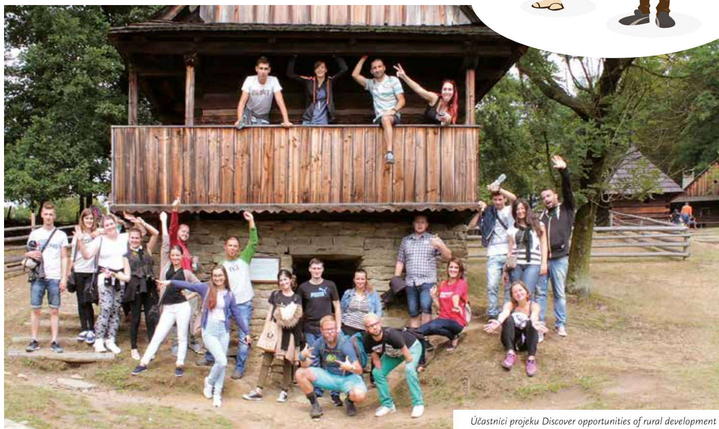
Účastníci projektu Discover opportunities of rural development