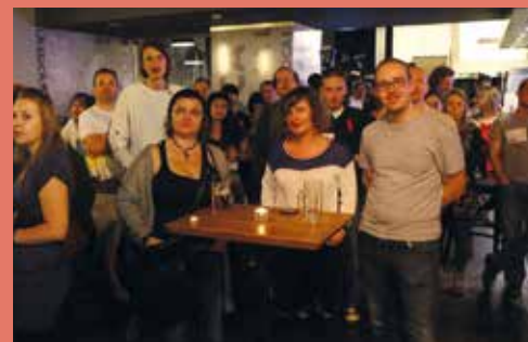
Večerní část Výročního setkání dobrovolníků EDS 2014

prezentací“, půjčit si v Živé knihovně čtivou živou knížku, prohlédnout si výstavu tvorby dobrovolníků s uměleckými sklony či zapojit se do některého ze zábavně laděných workshopů. Aktivní jedinci, z řad ex-dobrovolníků, kterým se nepovede přijít osobně, se můžou zapojit do soutěže-nesoutěže, ve které bude každý oceněn malou odměnou a poskytnout nám prostřednictvím emailu ludmila.miskanova@dzs.cz či poštou zajímavé výstupy z projektů (audio, video, psané, kreslené apod.), které budou na místě prezentovány formou výstavy. Samozřejmě nebude chybět ani tradiční party. Náklady na toto setkání včetně ubytování a stravy hradí bývalým dobrovolníkům Dům zahraniční spolupráce. Cestovní náklady