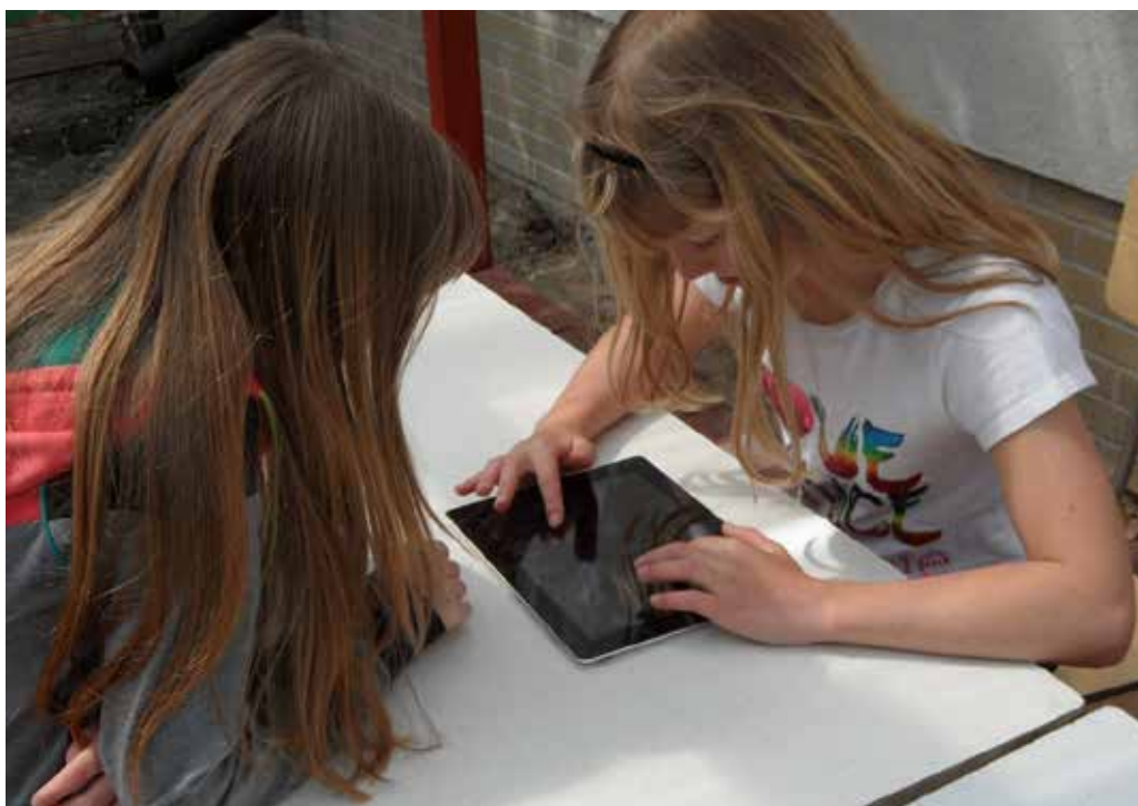
Tablety používají při výuce i žáci ZŠ Čakovice Praha 9.

Dům zahraniční spolupráce (DZS) je od roku 2013 partnerem evropského projektu Creative Classrooms Lab, který se zaměřuje na metodickou podporu využívání tabletů ve výuce. V prvním roce se do projektu zapojilo osm zemí, v ČR to byly téměř tři desítky škol. Výukové scénáře byly zaměřeny na personalizaci, jejich cílem bylo ukázat učitelům, že tablet je ideální pomůcka, díky které lze zohlednit potřeby různých typů žáků.