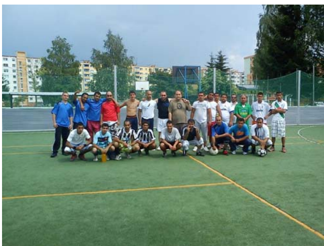
Futbalový turnaj členov a sympatizantov DAR