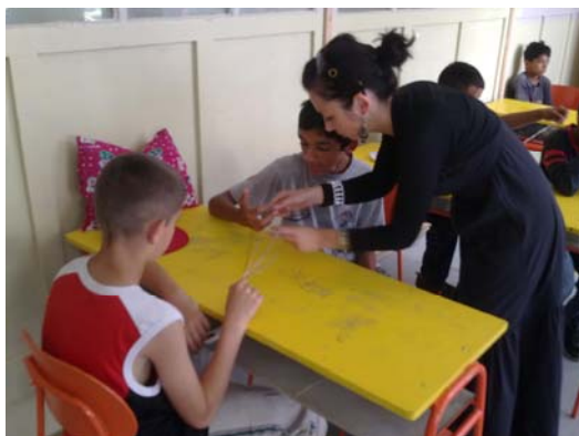
Tvorivé dielne - voľnočasové krúžky