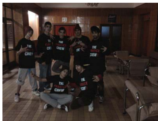
Fanaticx crew - Bboy / Bdance skupina