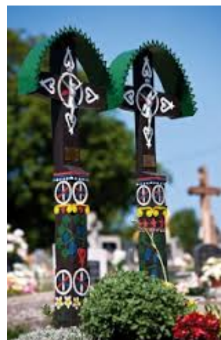
Symbolický cintorín v Detve