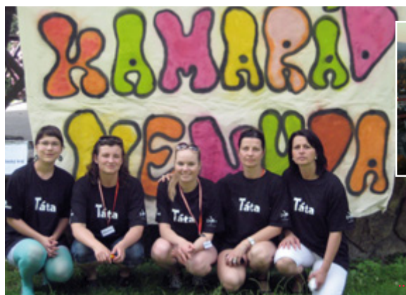
Život ve Zlíně s jeho specifickou architekturou byl zajímavou zkušeností. Zpětně jsem ale ráda, že jsem v Budapešti, obklopená klasicistními a barokními domy.