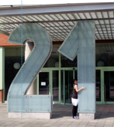
Objímám symbol Zlína, číslo značí umístění Zlínského mrakodrapu.

» Kde se tady můžu vyčurat? (Dopila jsem během povídání sklenku zlínské vody a pak ještě půl hodiny stojím ve dveřích a povídáme si, o tom, co přijde. Taký si říkáme, že o tom, co jsme zjistily, co jsme zažily, je třeba říkat dalším lidem.)