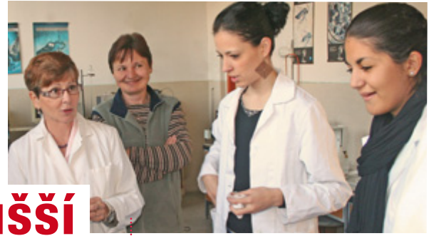
Studenti z Bratislavy v Kralupech