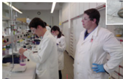
Čeští studenti titrují v Drážďanech.