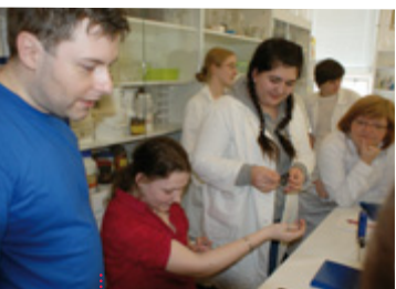
Měření v Bratislavě