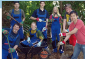
Práce na komunitní zahradě ve Walesu

Máte za sebou zhruba polovinu projektu, v červnu jste navštívili partnerskou skupinu a zúčastnili jste se campu ve Walesu. Jaké jsou zatím vaše zkušenosti a dojmy? Projekt je pro nás poměrně velkou výzvou, jelikož poprvé spolupracujeme s partnery, k nimž je potřeba zorganizovat cestu letadlem. Naše spolupráce je oboustranně prospěšná, jelikož i přes mírnou jazy-