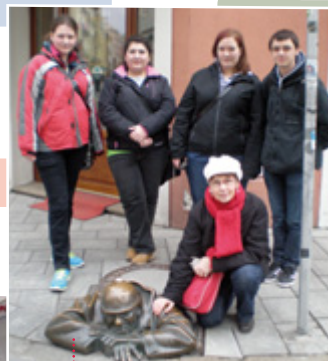
S ČUMILEM v Bratislavě

Že udělají moc dobře a ať se nebojí. Každý, kdo se podílel na tvorbě ŠVP, zvládne tvorbu jednotek učení. A pokud si najdou připraveného partnera, budou překvapeni, o kolik jsou organizace projektu, smlouva, kontrola, validace i další potřebné kroky jednodušší.