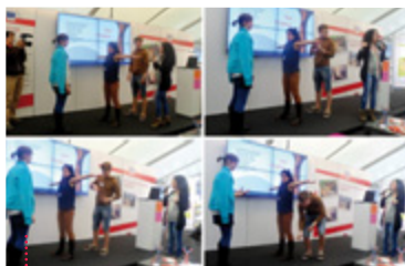
Během prezentace italského projektu