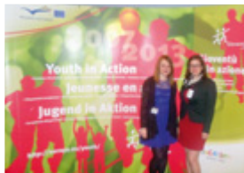
Před ceremoniálem spolu s českou absolventkou EVS v Maďarsku

Evropský týden mládeže, v jehož rámci jsem se zúčastnila YO!Festu, se konal ve dnech 26. 5. – 1. 6. 2013 v Bruselu. Česká národní agentura Mládež – Mládež v akci nominovala organizaci Together Czech Republic a její projekt Let's be Eurocitizens! v kategorii The Critical European Citizens cen Youth in Action. Projekt se v dané kategorii dostal mezi 11 nejlepších a na základě této skutečnosti jsem byla vyslána ho prezentovat.