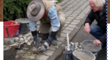
Kameny zmizelých na chodníku v Ratenicích