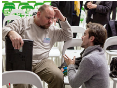
Do debaty se zapojily i další neziskové organizace.