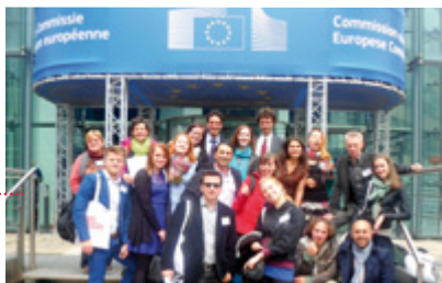
Po ceremoniálu před budovou Charlemagne