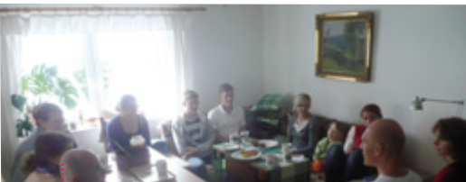
Ze schůzky mladých historiků