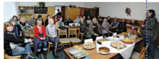
Vzpomínkové setkání s položením kamenů zmizelých Židů v Ratenicích

Zaznamenali jste nějaké reakce na váš půdní objev? Přišla reakce až ze zámorí. O nečekaném objevu se dozvěděli na Velvyslanectví České republiky ve Spojených státech a obratem nás požádali o spolupráci. Nalezené fotografie a dopisy tak puto-