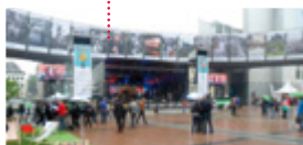
YO fest pódium