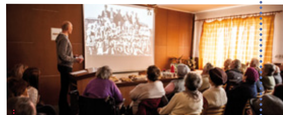
Zapomenuté fotky z Ratenic

valy za oceán a ve Státech byly předány jako dárek Miloši Formanovi u příležitosti jeho 80. narozenin.